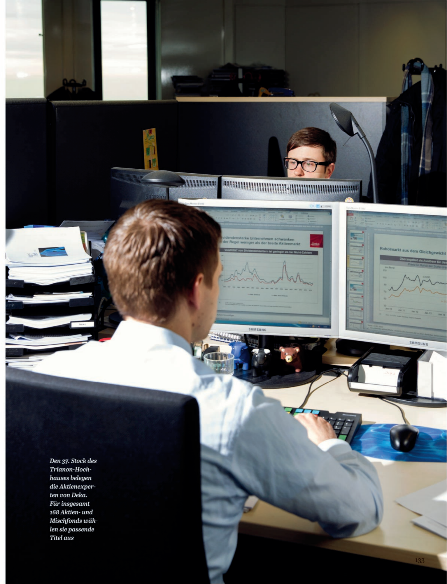
Illustration: Studio Nippoldt

Den 37. Stock des Trianon-Hochhauses belegen die Aktienexperten von Deka. Für insgesamt 168 Aktien- und Mischfonds wählen sie passende Titel aus